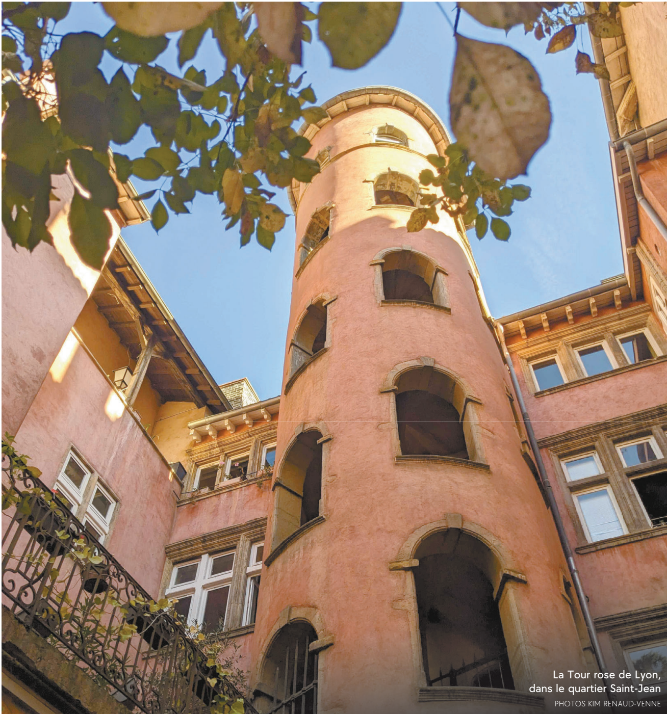
La Tour rose de Lyon, dans le quartier Saint-Jean