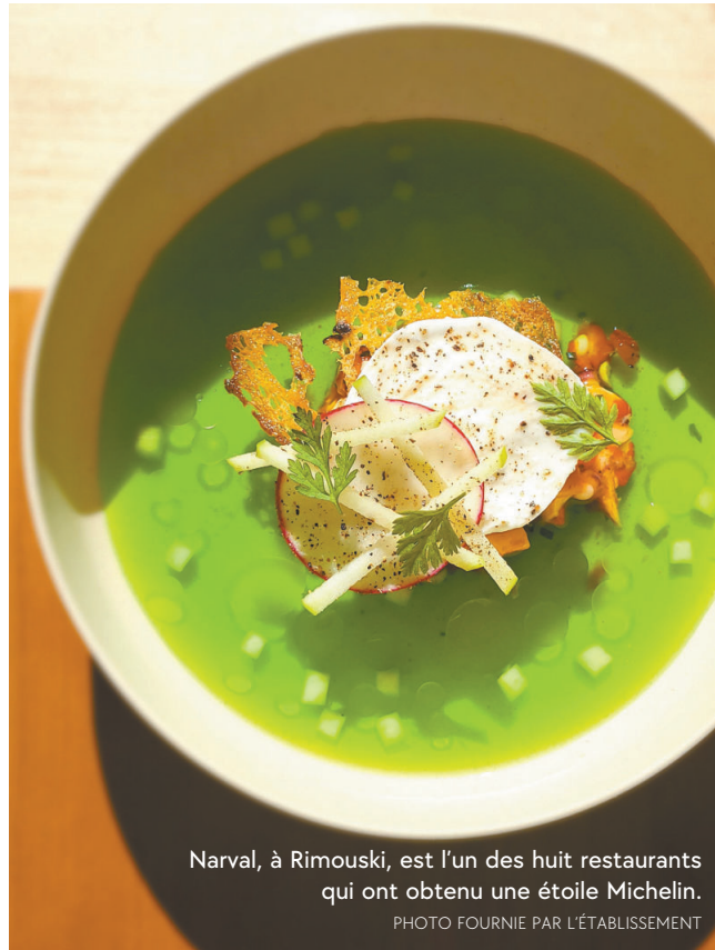
Narval, à Rimouski, est l'un des huit restaurants qui ont obtenu une étoile Michelin.