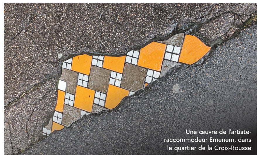
Une œuvre de l'artiste-raccommodeur Emenem, dans le quartier de la Croix-Rousse