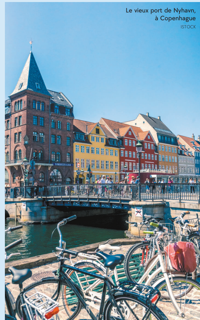
Le vieux port de Nyhavn, à Copenhague ISTOCK

Après le succès d'un projet pilote l'an dernier, la Ville de Copenhague lance officiellement CopenPay, cet été. Cette initiative permet de récompenser les touristes qui choisissent de voyager de façon responsable dans la capitale danoise, en leur offrant des rabais ou des expériences gratuites dans 90 attractions participantes. Parmi celles-ci, on compte la brasserie Carlsberg, le Musée du design, le Centre d'architecture danois, le Musée national et le château de Kronborg. Pour se prévaloir de ces avantages, nul besoin de preuve — on préfère fonctionner sur la base de la confiance, sauf exception. En tout état de cause, il faut cependant faire certains gestes pendant son séjour, comme participer à des activités de nettoyage public, se déplacer à vélo, arriver à Copenhague en train ou encore réserver quatre nuitées ou plus. Une idée qui, on l'espère, fera du chemin ailleurs sur la planète tourisme. copenpay.com