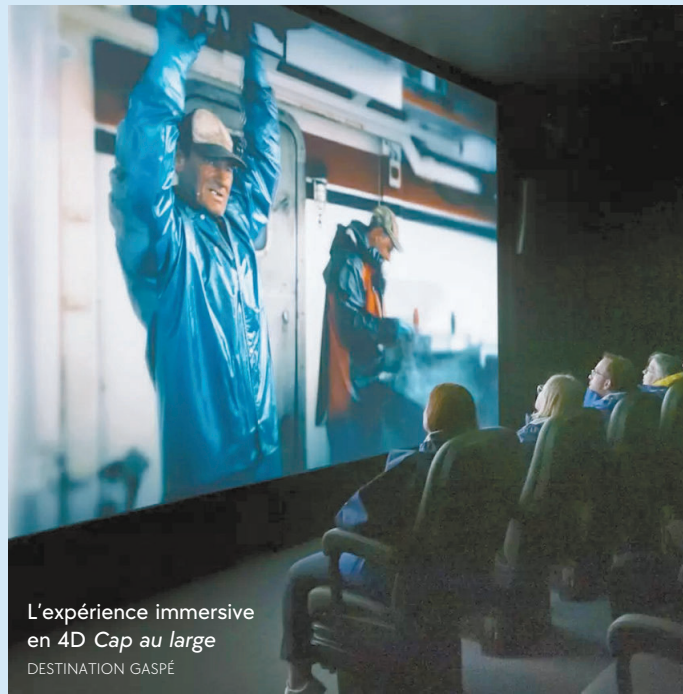
L'expérience immersive en 4D Cap au large DESTINATION GASPÉ

« Il y a trois sortes d'humains : les vivants, les morts et ceux qui vont en mer », disait le philosophe Anacharsis. Pour plonger dans le quotidien des marins, une nouvelle expérience immersive sera inaugurée le 20 juin, en Gaspésie. Baptisée Cap au large , elle donnera lieu à la projection d'un film en 4D qui transportera virtuellement les participants à bord d'un bateau de pêche commerciale gaspésien, avec plusieurs effets saisissants : sièges qui bougent au gré des vagues ou de la houle, souffle du vent dans les cheveux et bruine qui gicle sur les visages. Vêtus d'un imperméable de pêche, les marins d'eau douce d'un jour « ressentiront chaque vague et chaque vibration comme s'ils étaient en mer », mais aussi « la rudesse du métier de pêcheur et l'émotion brute de l'océan », assure-t-on. Après l'activité, on pourra arpenter à pied la promenade du Banc de Rivière-au-Renard, « capitale des pêches maritimes du Québec », mais aussi monter dans une tour d'observation et s'affaler sur la plage, avant de mettre le cap sur Gaspé ou Forillon, non loin de là. Tarif : 18 $, gratuit pour les moins de 18 ans. gaspesurplaisir.ca/cap-au-large-experience-4d