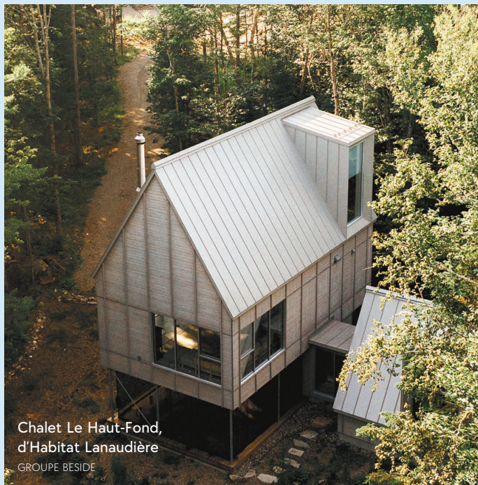
Chalet Le Haut-Fond, d'Habitat Lanaudière GROUPE BESIDE

Après avoir fait faillite en 2023 et s'être restructuré depuis, le Groupe Beside, qui versait à la fois dans l'édition de contenu et l'hébergement en nature, repart de plus belle. Pour ce faire, l'entreprise navigue dans les mêmes eaux, mais adopte une nouvelle approche en trois axes : publier des récits inspirants, offrir des séjours dans ses chalets design et proposer aux occupants toutes sortes d'expériences — cuisson de saumon sur braise, dégustation de vins locaux, marche guidée en forêt... entre autres choses. Côté hébergement, le site de villégiature en nature Habitat Lanaudière, qui n'a jamais cessé ses activités, continue d'offrir à la location 30 unités. Beside est aussi devenu partenaire du site de villégiature Territoire Charlevoix, qui compte une vingtaine d'hébergements à Sainte-Agnès, non loin de La Malbaie. Cette transition s'accompagne du lancement du site beside.earth , une plateforme repensée qui rassemble l'ensemble des activités de l'entreprise. Les visiteurs peuvent y réserver des séjours, accéder à du contenu éditorial et explorer une sélection de produits et d'expériences en harmonie avec la vision responsable et durable de Beside.