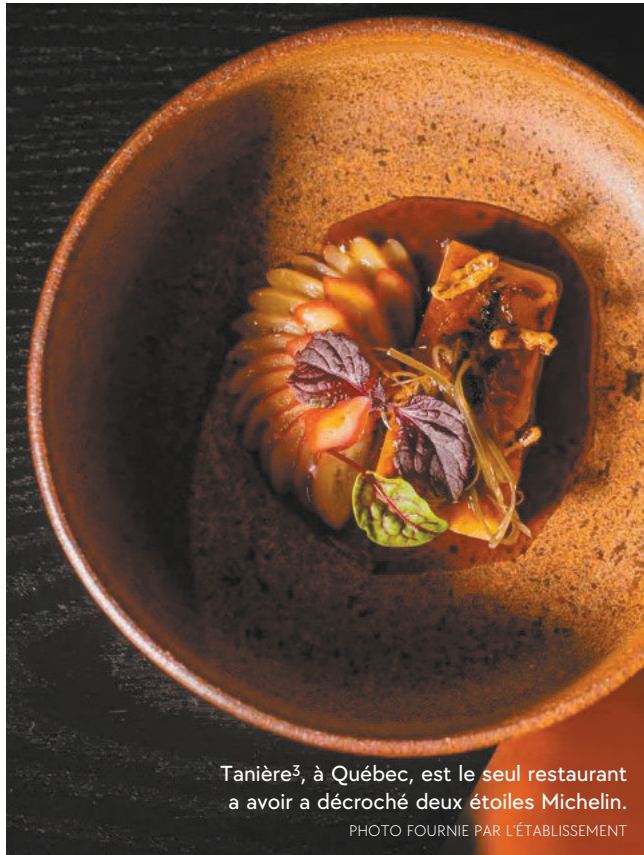
Tanière 3 , à Québec, est le seul restaurant à avoir décroché deux étoiles Michelin.