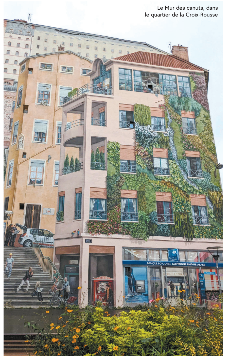
Le Mur des canuts, dans le quartier de la Croix-Rousse