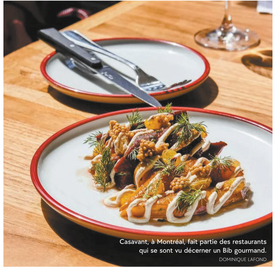
Casavant, à Montréal, fait partie des restaurants qui se sont vu décerner un Bib gourmand. DOMINIQUE LAFOND